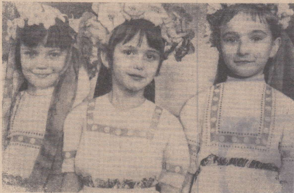
В Дзержинском детском саду № 1.